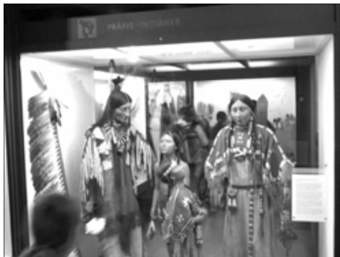
Expozice v muzeu Karla Maye