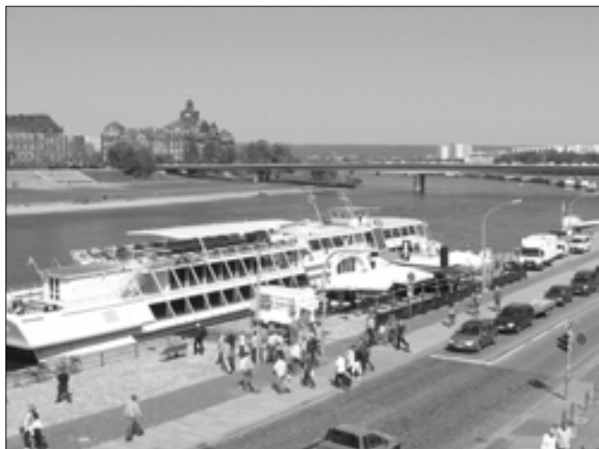
Cesta parníkem na hrad Pillnitz